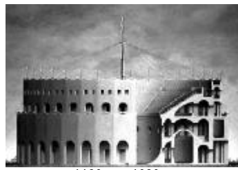
1120mm x 1620mm