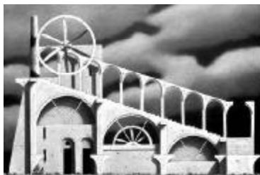
606mm x 910mm