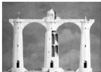
652mm x 910mm

「MINORU NOMATA」は、234点の絵画をリトグラフ、3DそしてL.A.録音のアンビエントサウンドと共に楽しみいただけるソフトです。